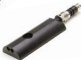
Turbidez según ISO7027