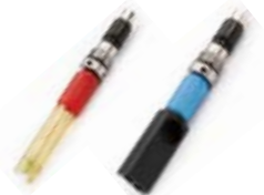
pH, mV CE