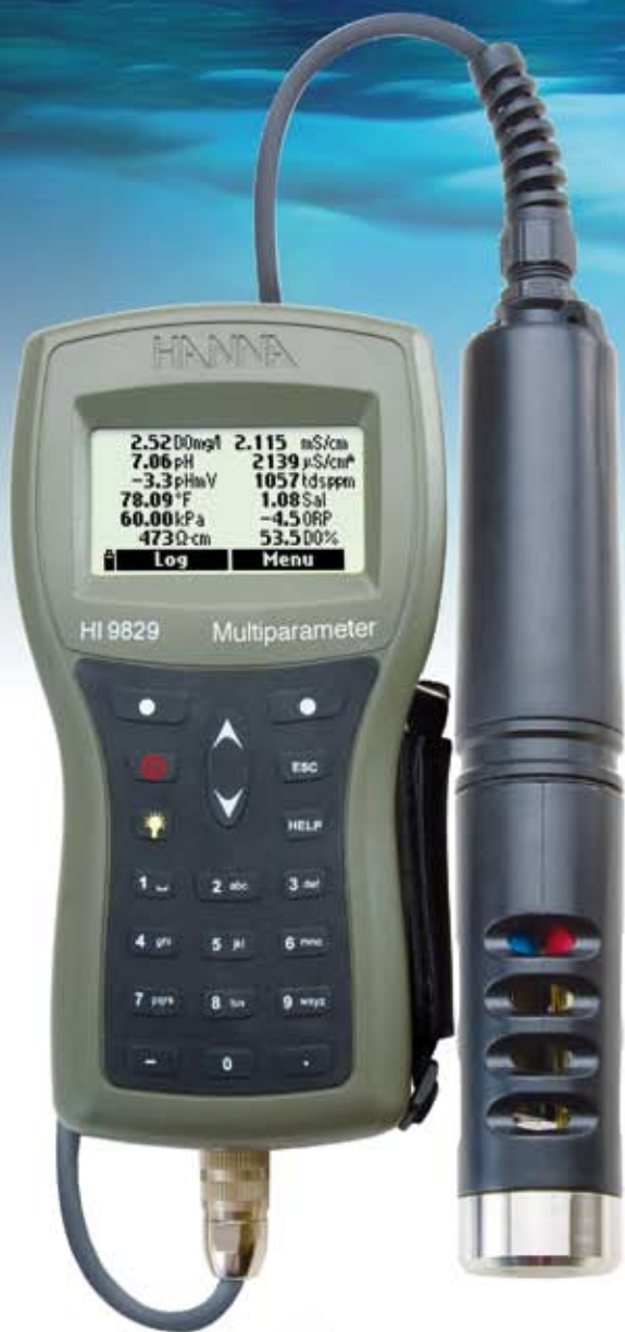
Sonda registradora con autonomía de hasta 70 días.