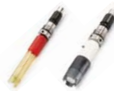
pH, mV OD

Longitud de sonda disponible en 4, 10 y 20 m.